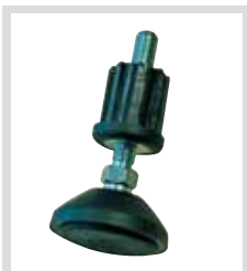
Регулируемые по высоте опоры предлагаются в качестве комплектующих устройств безопасности